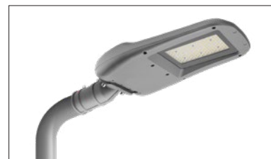
Fissaggio a frusta Pendant Mounting

Per palo \varnothing 60mm For a 60mm diameter pole