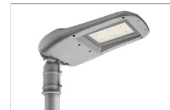
Fissaggio testapalo Pole Head Mounting